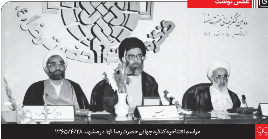
مراسم افتتاحیه کنگره جهانی حضرت رضا (ع) در مشهد، ۱۳۶۵/۴/۲۸