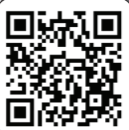
شرکت در پویش روایت # مهمونی_غدیر