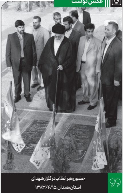
حضور رهبر انقلاب در گلزار شهدای استان همدان، ۱۳۸۳/۴/۱۵