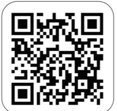
شرکت در پویش روایت # مهمونی_غدیر

رسانه KHAMENEI.IR همگام با آحاد ملت ایران برای برگزاری مهمانی های عید غدیر در قالب پویش روایت # مهمونی_غدیر از کاربران شبکه های اجتماعی دعوت میکند تا تصاویر و فیلم های حضور خود در مهمانی عید غدیر در اقصی نقاط ایران و جهان را به صفحه پویش ارسال یا با هشتگ روایت # مهمونی_غدیر در فضای مجازی منتشر کنند.