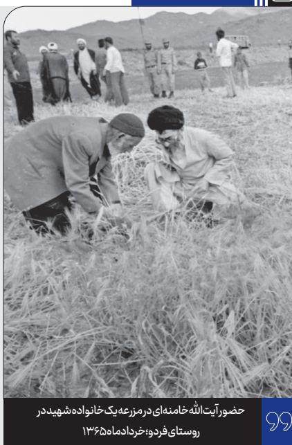
حضور آیت الله خامنه ای در مزرعه یک خانواده شهید در روستای فردو، خردادماه ۱۳۶۵