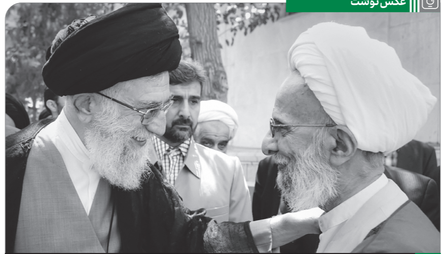
تصویری از دیدار صمیمانه آیت‌الله مصباح یزدی با رهبر انقلاب، سال ۱۳۹۳

دابی مارگن‌اشدیه‌شن‌امزرمه‌و س‌دنه‌ملا‌ی‌ده‌موبا‌وی‌ناملیسم‌ساق‌ح‌ا‌ح‌ت‌داهش‌زورلاس‌؛‌ه‌ام‌ی‌د‌۱۳