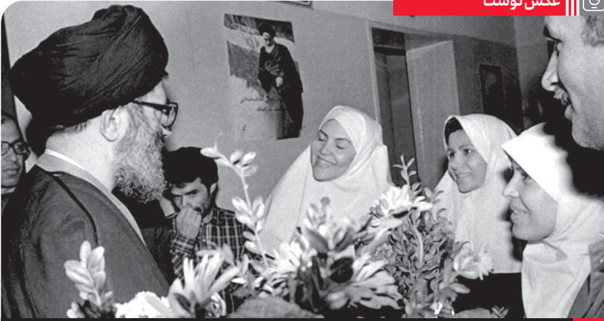
دیدار آیت الله خامنه ای با پرستاران و کارکنان بیمارستان بقیة الله (عج) ۶ اردیبهشت ۱۳۶۵