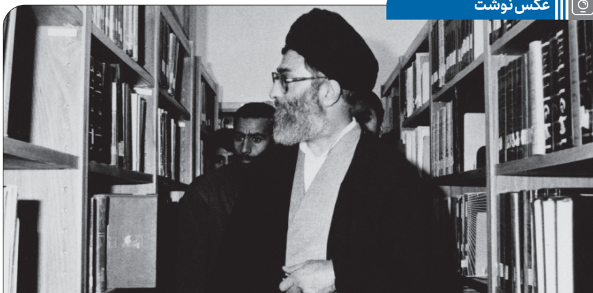
تصویری از آیت الله خامنه ای در حال بازدید از یک کتابخانه در جریان یکی از سفرهای استانی دوره ریاست جمهوری

دهم ربیع الثانی، سالگرد رحلت حضرت معصومه (ع) تسلیم باد