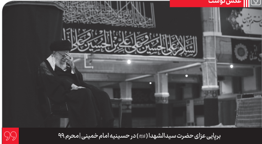
برپایی عزای حضرت سیدالشهدا (رضی الله عنه) در حسینیه امام خمینی | محرم ۹۹