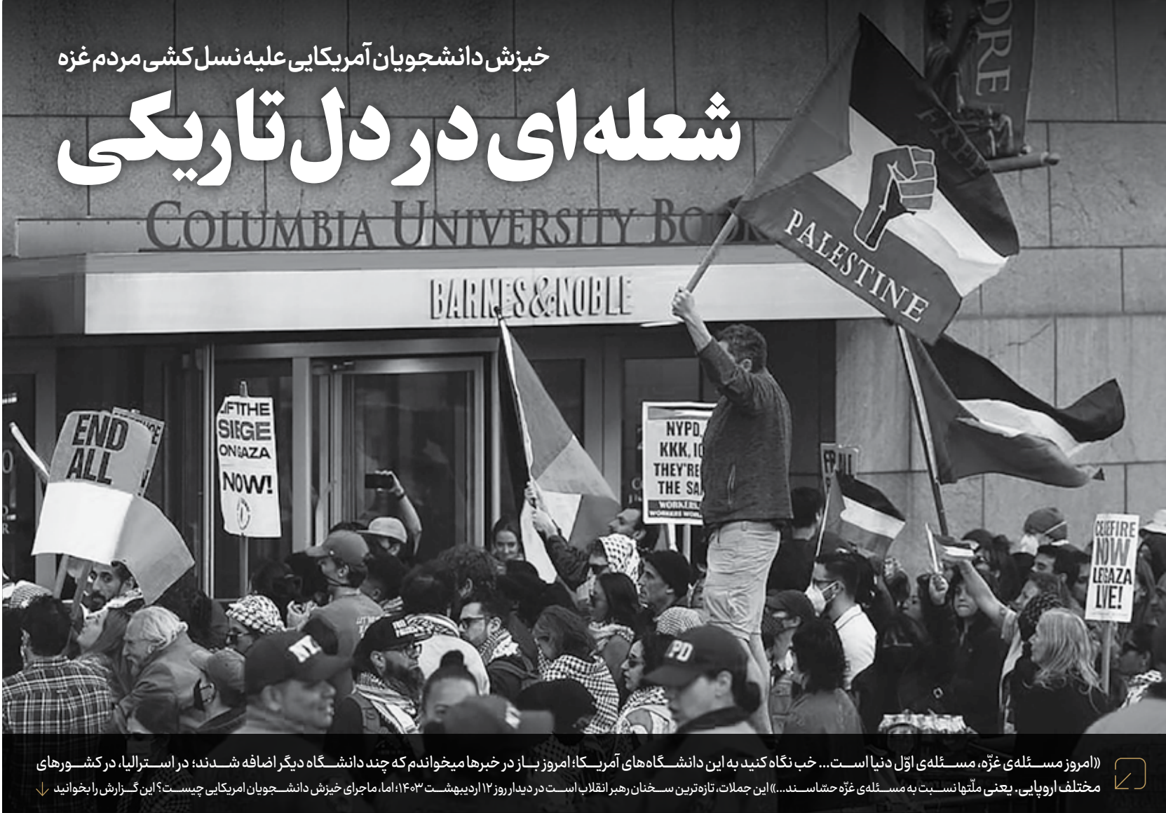
(امروز مسئله‌ی غزه، مسئله‌ی اول دنیا است... خوب نگاه کنید به این دانشگاه‌های آمریکا: امروز بازار در خبرها میخوانند که چند دانشگاه دیگر اضافه شدند در استرالیا، در کشورهای مختلف اروپایی، یعنی مثلثا نسبت به مسئله‌ی غزه مهاسند... ) این جغات، تازه‌ترین سفخنان رهبر انقلاب است در دیدار روز ۱۲ اردیبهشت ۱۴۰۳ اما ماجرای خورش دانشجویمان آمریکایی چیست؟ این گزارش را بخوانید