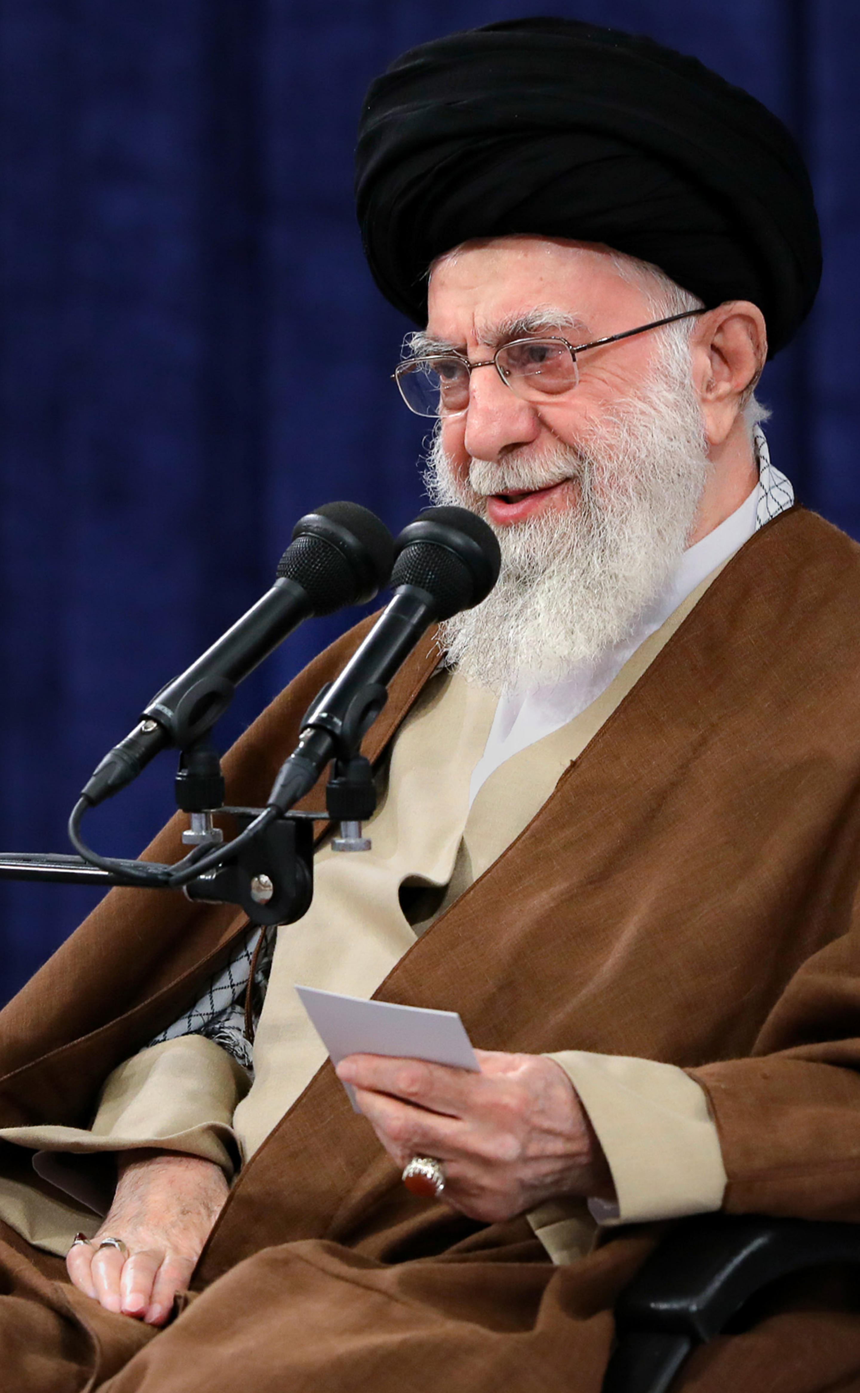
بیانات رهبرانقلاب در دیدار اعضای ستاد برگزاری کنگره‌ی بین‌المللی بزرگداشت علامه طباطبائی