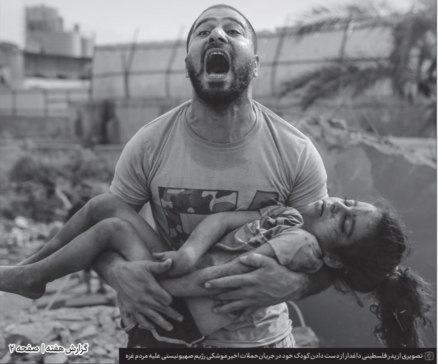
تصویری از پدر فلسطینی دادگار از دست دادن کودک خود در جریان حملات اخیر موشکی رژیم صهیونیستی علیه مردم غزه