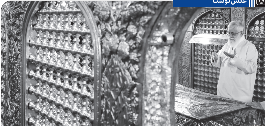
غبارروبی مضع مطهر حضرت امام رضا علیه السلام، ۱۳۹۷/۵/۱۸