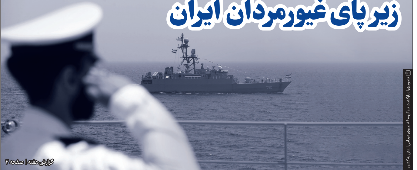
تصویری از ناوگروه ۸۶ نیروی دریایی ارتش به کشور