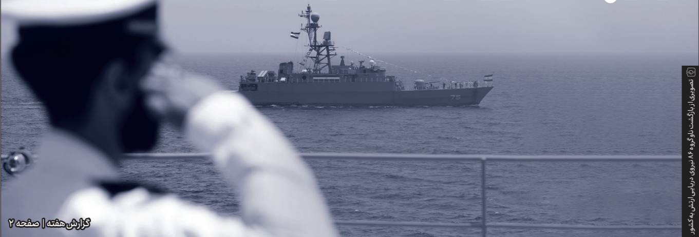
تصویری از ناوگشت ناوگروه ۸۶ نیروی دریایی ارتش به‌کشمور