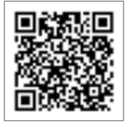
برای دریافت متن بیانات اسکن کنید