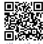
برای دریافت متن بیانات اسکن کنید