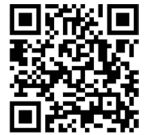
برای دریافت متن بیانات اسکن کنید

موفقیت‌های برشمرده شده در بیانیته‌ی گام دوم