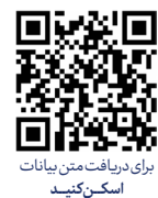
برای دریافت متن بیانات اسکن کنید