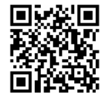
برای دریافت متن بیانات اسکن کنید