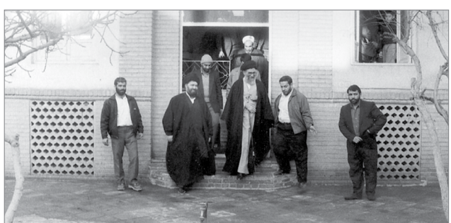
حضور رهبر انقلاب در منزل امام خمینی (ره) در شهر قم | ۷۰/۱۲/۱

جنگ‌افروزی‌هایی که در جهان علیه انقلاب اسلامی است، معلوم نبود موفقیت بیشتری از افراد موجود به دست می‌آوردند. در یک تحلیل منصفانه از حوادث انقلاب خصوصاً از حوادث ده سال پس از پیروزی باید عرض کنم که انقلاب اسلامی ایران در