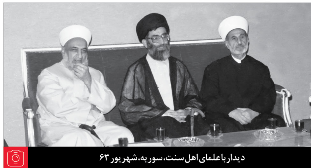
دیدار با علمای اهل سنت، سوریه، شهریور ۶۳

و امیدوارم که مغزها را به کار بیندازند و آن خوف‌هایی که ایجاد کرده بودند در کشور ما، آن راهم کنار بگذارید و با شجاعت وارد بشوید و کار خودتان را انجام بدهید. همان طوری که با شجاعت، ابرقدرت‌ها را خارج کردید با